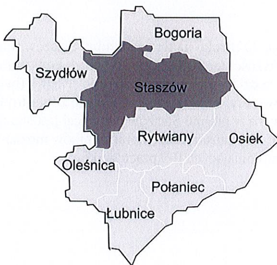
Rysunek 1. Gmina Staszów w powiecie staszowskim

Gmina Staszów zajmuje obszar 225,9 km 2 . Według danych GUS Gmina liczy 24.888 mieszkańców, a gęstość zaludnienia to w przybliżeniu 110,2 osoby/km 2