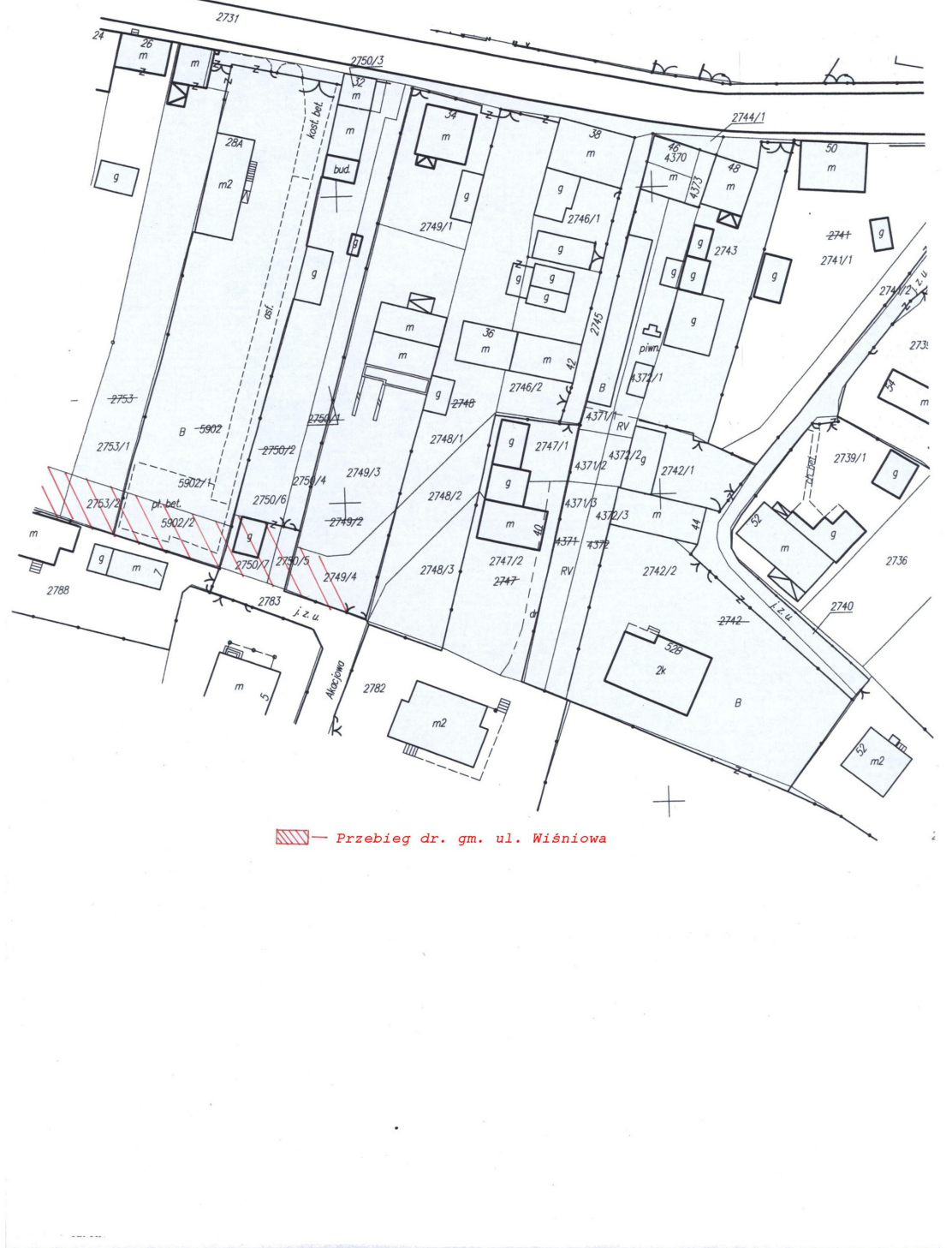
▨— Przebieg dr. gm. ul. Wiśniowa